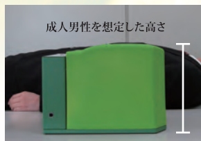
実際の胸の高さとの比較 (成人男性)